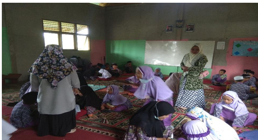
Gambar 4. Kegiatan Mengaji Setelah Shalat Dhuha

Guru adalah sosok figur atau perantara yang dapat menentukan kemajuan dan kesuksesan suatu bangsa melalui pendidikan. Dengan berbagai bentuk upaya meningkatkan pendidikan di Indonesia dan tak lupa upaya yang telah dan akan dilakukan untuk meningkatkan kinerja guru, khususnya Guru Pendidikan Agama Islam.