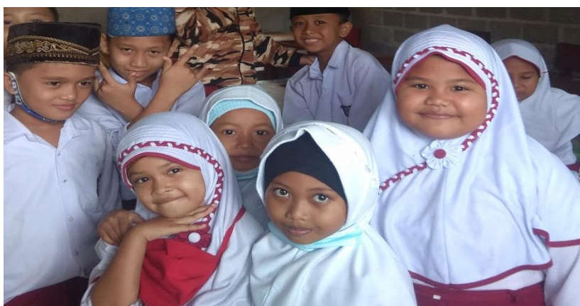
Gambar 5. Peserta didik kelas IV

Hasil wawancara tentang kendala yang dihadapi dalam upaya pemanfaatan fasilitas pembelajaran dalam meningkatkan kinerja Guru Pendidikan Agama Islam (PAI) di SDIT Nurul Balad tersebut bahwa “kendala dalam menyampaikan sebenarnya tidak banyak kendala dalam menyampaikan karena zaman sekarang kan sudah modern jadi bisa kalau misalnya anak tidak paham dengan apa yang kita jelaskan, mungkin merasa bosan dengan apa yang kita jelaskan dengan metode ceramah jadi kita alihkan dengan menggunakan Handphone, Laptop alihkan kita contohkan dengan lagu atau video Rukun Islam, nama-nama Malaikat itu-kan sudah ada jadi kita putarkan itu. [9].