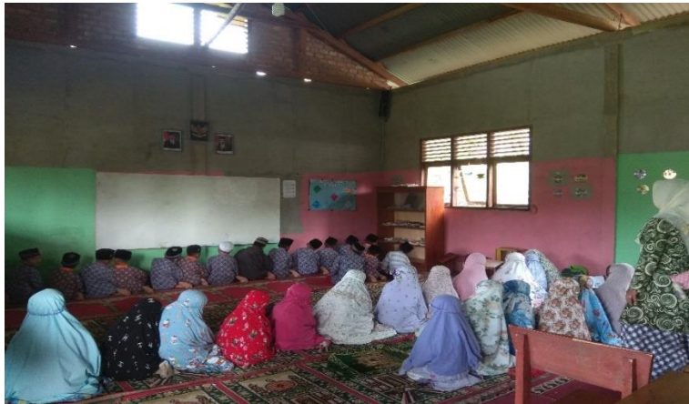
Gambar 3. Shalat Dhuha SDIT Nurul Balad

sekitar. Guru Wali Kelas mengungkapkan bahwa “terkadang tambahan dari Wali Kelas dan Guru pengajar kalau memang benar-benar anak tersebut tidak dapat menangkap dan tidak lancar di waktu pembelajaran, dapat di bantu sesudah Zuhur, kami juga banyak kegiatan seperti Shalat Dhuha di pagi hari, liqo’, ngaji, hafalan dan banyak lagi”. [10] Hasil observasi yang dilakukan Guru Pendidikan Agama Islam (PAI) berupaya meningkatkan kinerjanya dalam mengajar walaupun terkadang tidak di sediakan oleh pihak sekolah.