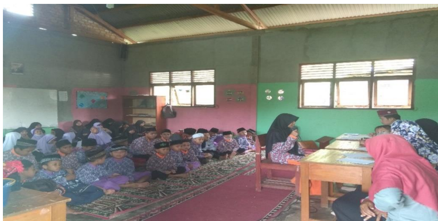
Gambar 2. Lomba Hafalan Al-Qur'an Juz 30

satunya menyediakan internet yang ada di sekolah untuk mencari informasi dan menambah wawasan tentang materi pelajaran yang dipelajari.